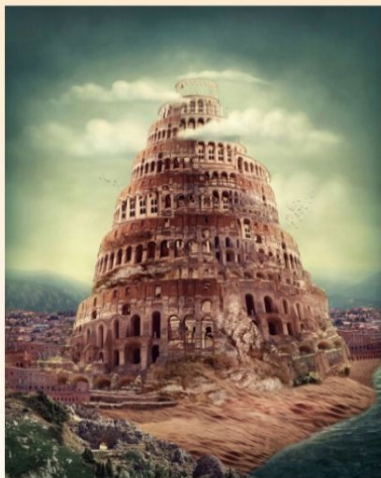
Tour de Babel

Cette conférence propose d'expliquer et de présenter les apports culturels et patrimoniaux des différentes périodes qui ont marqué l'histoire mouvementée de cette région qui demeure une zone conflictuelle aux enjeux majeurs en ce début de XXI e siècle.