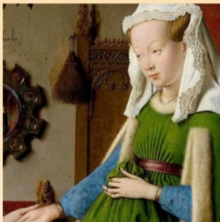
Jan Van Eyck, Les Epoux Arnolfini (détail) , 1434, National Gallery, Londres.

Dimanche 3 octobre 2021, à 10h30, Van Eyck : le détail magnifié par Gregory Vroman , conférencier en histoire de l'art