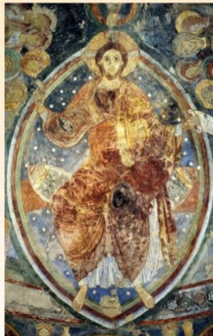
Berzé-la-Ville, chapelle des Moines, Le Christ Pantocrator , 12 e siècle.

À partir du 11 e siècle, la peinture monumentale connaît un développement sans précédent en Europe. Les chantiers de construction d'églises se multiplient. Cette architecture romane nouvelle offre de vastes surfaces qui vont recevoir de splendides peintures à fresque. Ces peintures illustrent les apports majeurs de l'art de l'Empire d'Orient, transmis notamment par le Mont Cassin à l'abbaye de Cluny, le plus grand centre spirituel de la chrétienté occidentale. Les expériences régionales vont imposer des solutions originales, des figures sensibles et plus nerveuses s'éloignent progressivement des décors et de la massivité byzantine.