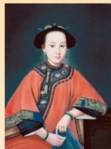
Attribué à Castiglione ; Portrait de Rong, concubine de Qianlong, vers 1750 , Musée National du Palais, Taipei

Chine manifesté dans l'œuvre de peintres comme Boucher.